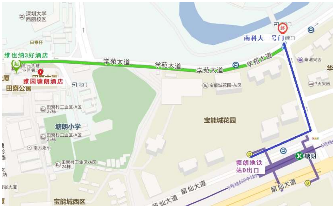
酒店、塘朗地铁站到南科大一号门路线图